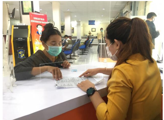
Pelayanan Loker Informasi

Jumlah Permohonan Perizinan Yang Masuk Sebanyak 116 Berkas