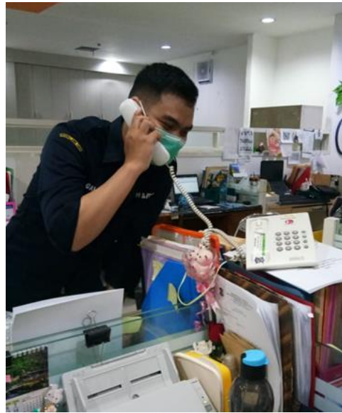
PT Maxlaga Sentosa Industri

Jumlah Perusahaan yang Diberikan Asistensi Online Sebanyak 2 Perusahaan