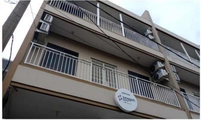
Jl. Rungkut Mejoyo Selatan XI No. 3 Blok AL 11