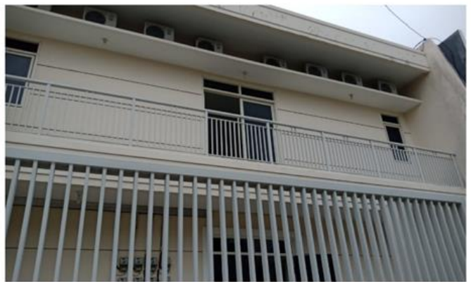
Jl. Rungkut Mejoyo Selatan III No. 37 Blok N 23