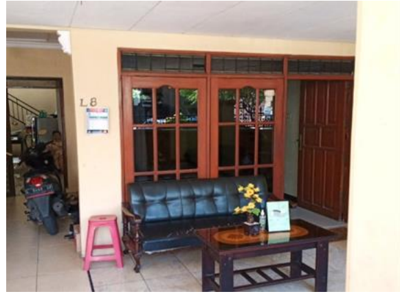
Sumber Nikmat Jl. Baruk Timur II No. 39