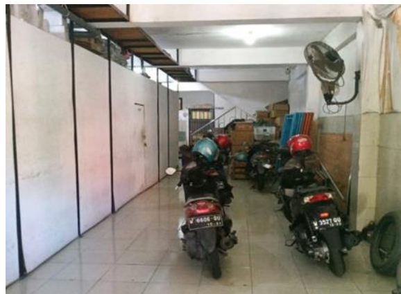
PT Bramindo Niaga Pratama Jl. Raya Rungkut Alang-Alang No. 25