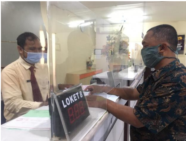
Pelayanan Loker Customer Service