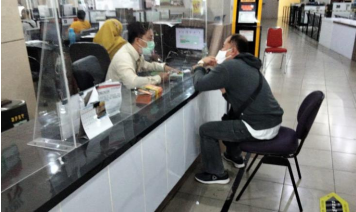
Pelayanan Loker Informasi