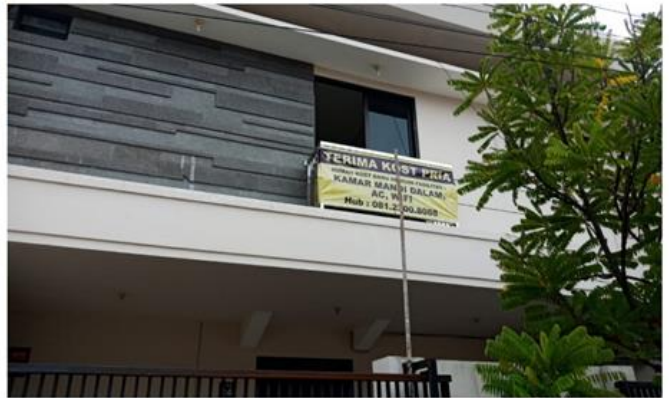
Jl. Rungkut Mejoyo Selatan VI No. 24 Blok Z 12