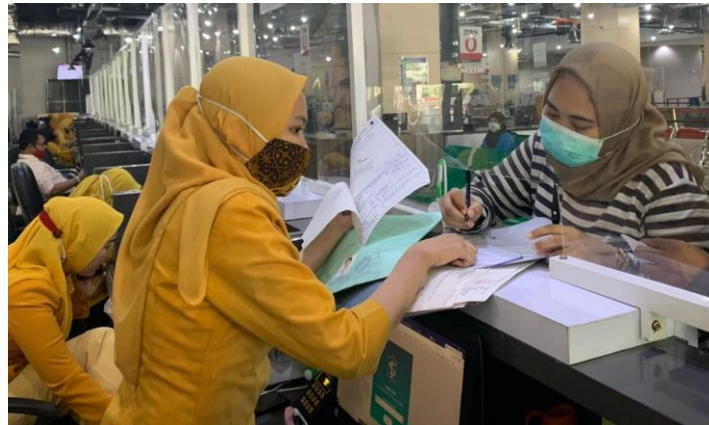
Pelayanan Loker Customer Services

Jumlah Permohonan Perizinan Yang Masuk Sebanyak 111 Berkas