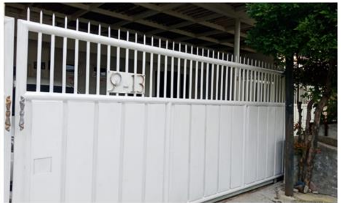
Jl. Rungkut Mejoyo Selatan VIII No. 21 Blok Q 13