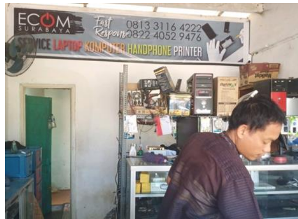
UD Ecom Surabaya Jl. Raya Medokan Sawah No. 57