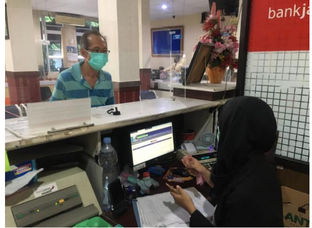
Pelayanan Loker Bank Jatim