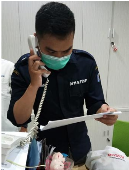
PT Integritas Mitra Bersatu