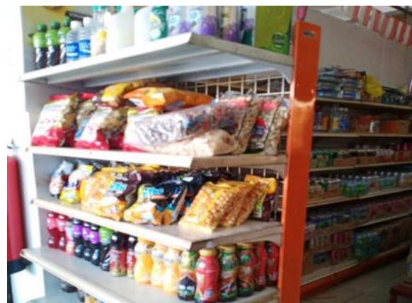
Toko Horison Jl. Rungkut Industri Kidul No. 23 A