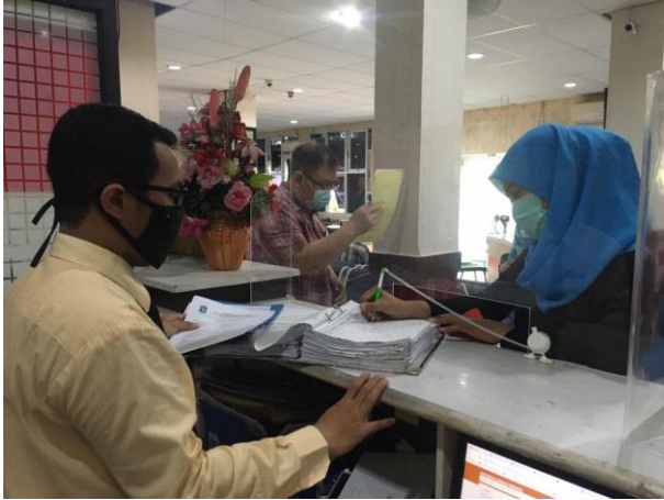
Pelayanan Loker Pengambilan