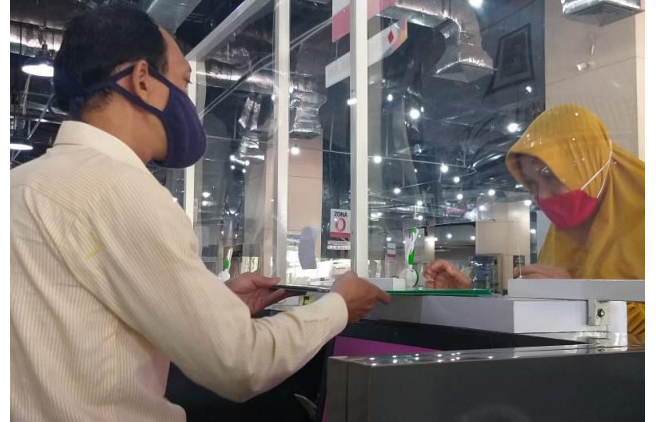
Pelayanan Loker Pengambilan