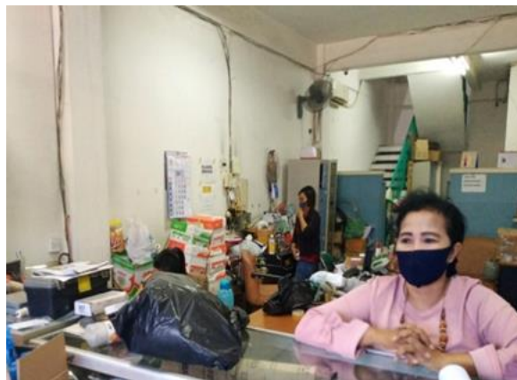
UD Sinus Elektrik Heat Pratama Jl. Rungkut Industri Kidul No. 30