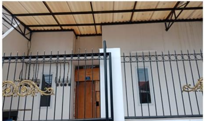
Jl. Rungkut Mejoyo Selatan III No. 25 Blok N29