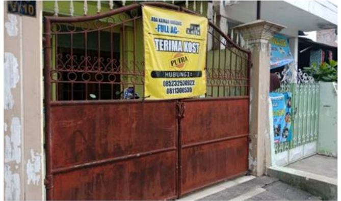
Jl. Rungkut Mejoyo Selatan V No. 10