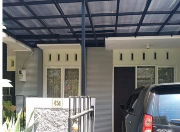
CV Citra Pandugo Jl. Rungkut Harapan Blok C No. 51